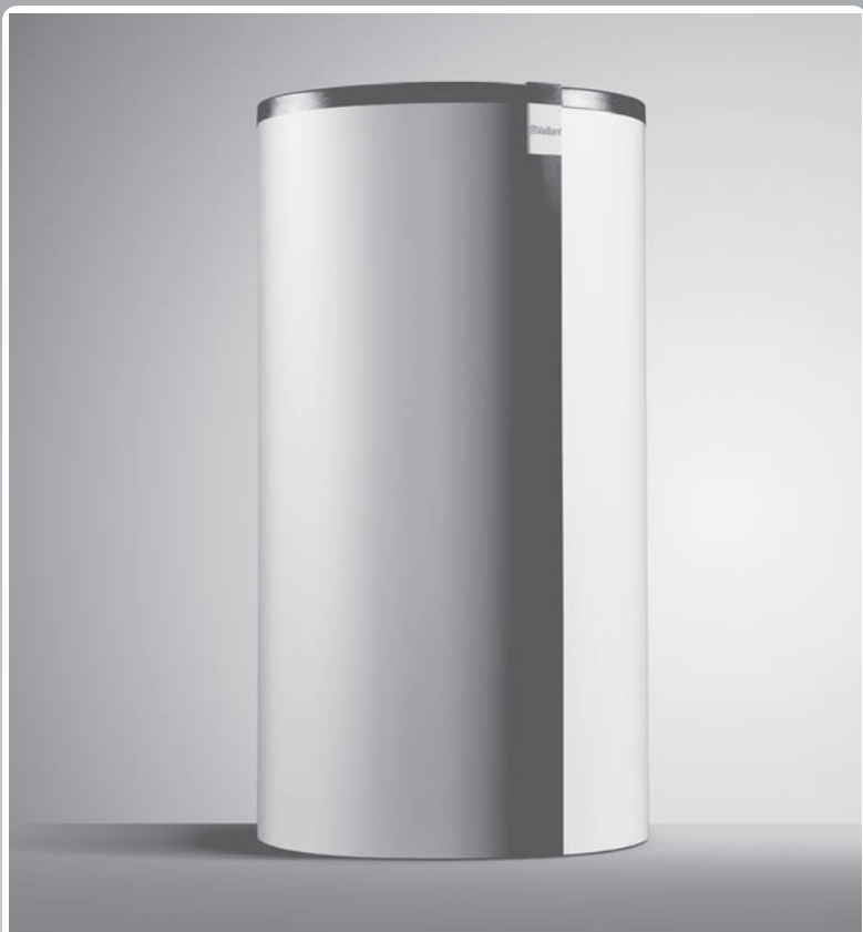
Vmesni zbiralnik aIISTOR